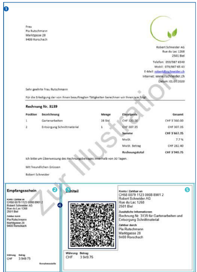
QR-Rechnung mit Zahlteil